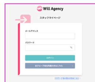
スタッフマイページ

1回（1振込）あたり、一律「165円」 ※振込先がイオン銀行の場合は、無料です。 ※振込金額が3万円以上の場合は、利用料は「330円」となります。